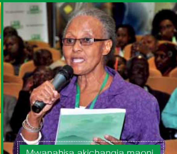
Mwanahisa akichangia maoni.