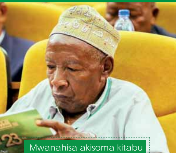
Mwanahisa akisoma kitabu cha Mkutano Mkuu.